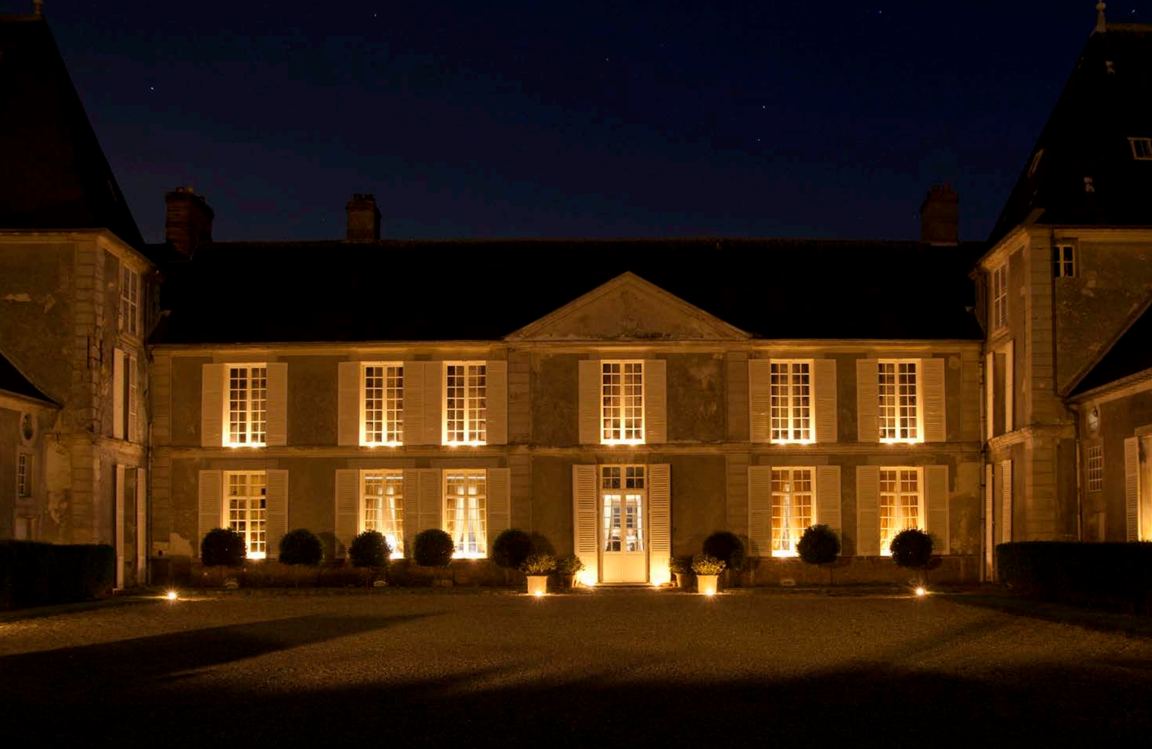
CHÂTEAU de JANVRY